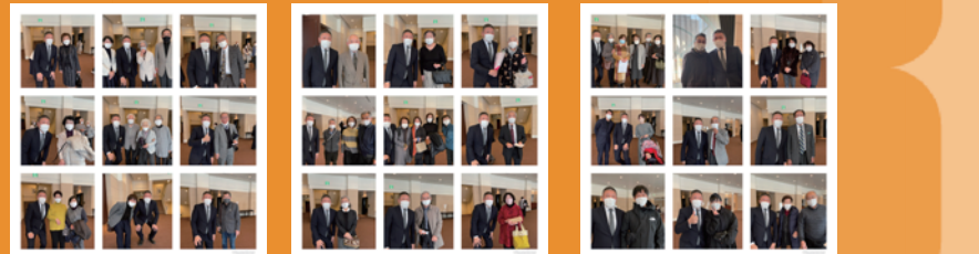
パーティ当日、スタッフの段取りに不備があり、写真撮影できなかった参加者の皆様には、この場を借りて心よりお詫び申し上げます。